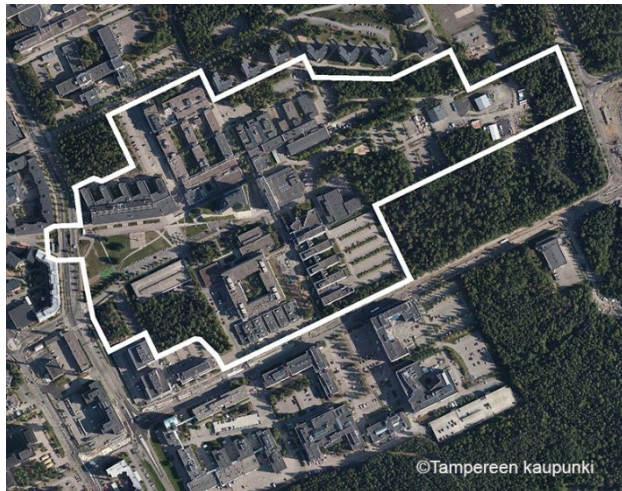
Kaavan suunnittelualue ilmakuvassa